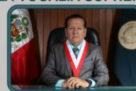
GENERAL CJ PNP (R) Francisco LLERENA BOCCOLINI FISCAL SUPREMO ANTE LA VOCALÍA SUPREMA