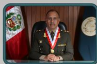
GENERAL DE BRIGADA EP Anibal VILLAVICENCIO VILLAFUERTE VOCAL SUPREMO DE LA VOCALÍA SUPREMA