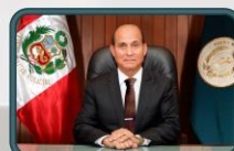
CONTRALMIRANTE CJ Luis TEMPLE DE LA PIEDRA