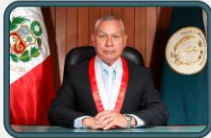
GENERAL DE BRIGADA SJE Alonso ESQUIVEL CORNEJO VOCAL SUPREMO DE LA SALA SUPREMA REVISORA