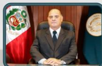
CONTRALMIRANTE CJ Hernán PONCE MONGE