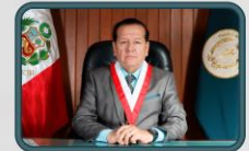
GENERAL CJ PNP Francisco LLERENA BOCCOLINI FISCAL SUPREMO ANTE LA SALA SUPREMA DE GUERRA