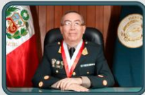
GENERAL CJ PNP Emilio ARCE DE LA TORRE BUENO VOCAL SUPREMO DE LA SALA SUPREMA DE GUERRA