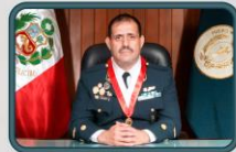
MAYOR GENERAL CJ FAP Arturo Antonio GILES FERRER PRESIDENTE DE LA SALA SUPREMA DE GUERRA