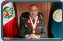
GENERAL DE BRIGADA SJE Anibal VILLAVICENCIO VILLAFUERTE VOCAL SUPREMO DE LA VOCALÍA SUPREMA