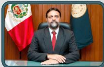
CAPITÁN DE NAVÍO CJ Carlos HUBY CISNEROS SECRETARIO GENERAL DEL FMP